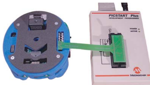
FIG. 2.2 – Connexion à Hemisson

Connectez ensuite le module à Hemisson comme suit :