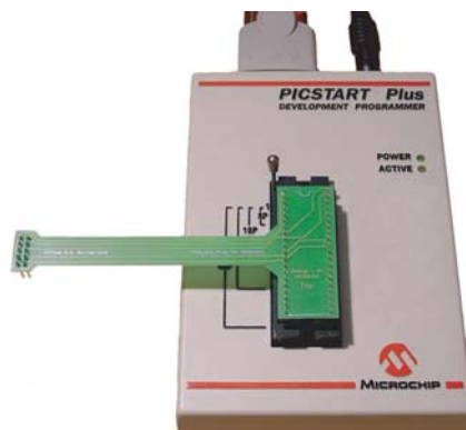
FIG. 2.1 – Connexion entre l'adaptateur et le programmeur

Avant la phase de reprogrammation, il faut réaliser la connexion physique entre Hemisson et le boîtier programmeur externe. Pour cela, commencez par connecter le module HemFlexExtProg au programmeur externe, en respectant l'orientation :